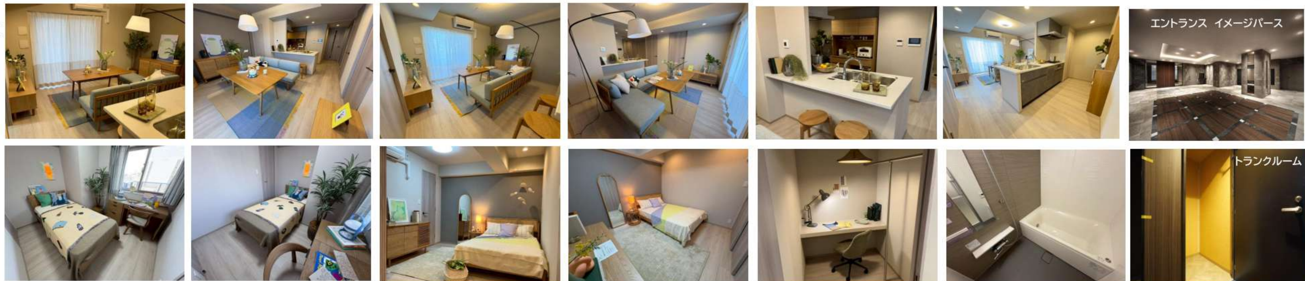
エントランス イメージパース