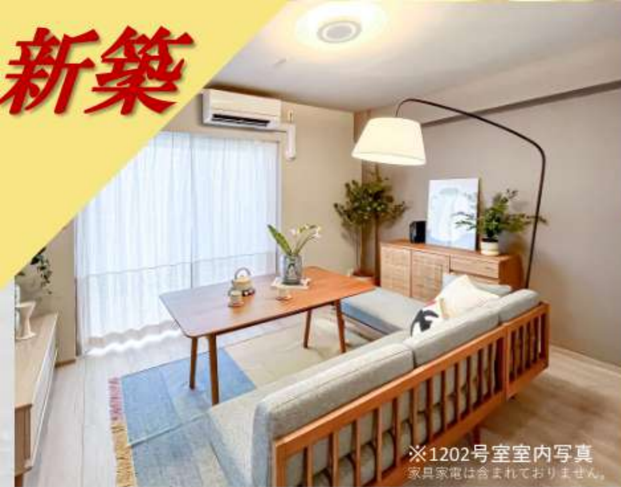
※1202号室室内写真 家具家電は含まれておりません。

自分らしいライフスタイルを描ける洗練された佇まい。日常のあらゆるシーンに心地よさと上質さを提案する設備と仕様。