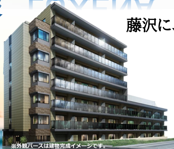
※外観パースは建物完成イメージです。