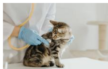
無料ペット相談 アニコム24時間電話相談