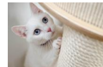
強い壁紙 汚れや臭いに強い壁紙