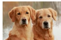
大型犬相談 飼育細則、頭数制限あり