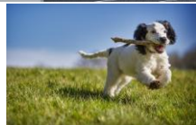
芝生ドッグラン 屋上に天然芝生のドッグラン