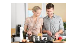
タッチレス水栓 2LDK以上の住戸