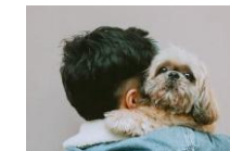
ハンズフリー鍵 エントランスと玄関