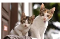
多頭飼い可 飼育細則、頭数制限あり