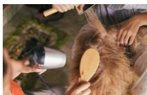
箱型の乾燥機 トリミングルームに設置