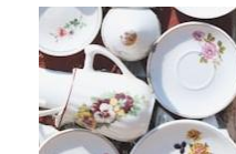
食洗器 2LDK以上の住戸

■所在地/神奈川県藤沢市弥勒寺1丁目6番1号 ■竣工2026年1月27日 ■入居可能日:2026年2月21日 ■交通/JR東海道線「藤沢」駅南口徒歩12分、江ノ島電鉄「藤沢」駅徒歩18分 ■構造・規模/鉄筋コンクリート造地上7階建 ■総戸数/41戸 ■間取り/1LDK・2LDK・3LDK ■専有面積/35.18㎡~66.04㎡ ■敷金/0ヶ月(ペット飼育時/小型犬・猫合わせて2匹の場合敷金+1ヶ月/その他の場合敷金+2ヶ月) ■償却なし ■礼金/0ヶ月 ■共益費/10,000円(G・H・I Itype) 20,000円(A・B・C・D・E・Ftype) ■契約期間/2年間 ■更新料/新賃料の1ヶ月分 ■火災保険/21,500円/2年間 ■保証会社/必須(エポスカード保証のみ) 初回保証料50%、月額保証料 月額支払総賃料の1% ※貸主の認める法人契約の場合、加入不要。但し、敷金1ヶ月に変更。 ■ペット登録/ペット登録費用5,500円(10%税込) ペット追加時登録費用3,300円(10%税込) ※申込時に必要書類提出・ペット審査有 ■鍵設定費/11,000円(税込) ■ルームクリーニング代/Atype:102,300円(税込) B・E・Ftype:101,200円(税込) Ctype:97,900円(税込) Dtype:94,600円(税込) G・Htype:55,000円(税込) Itype:64,900円(税込) ■エアコンクリーニング費用/1台につき19,800円(税込) ■駐車場(25台)/機械式21台:11,000円~16,500円(税込/台)、平置き3台:22,000円(税込/台) ※サイズ奥行4,900×幅2,200・敷金1ヵ月、契約事務手数料1.1ヵ月、敷地外1台:16,500円(税込/台)敷金1ヵ月、契約事務手数料1.1ヵ月 ■バイク置場(3台)/月額5,500円(税込/台)敷金1ヵ月、契約事務手数料1.1ヵ月 ■駐輪場(56台)/月額220円(税込/台) ※入居期間中に駐輪場を新規で使用する場合、ステッカー発行手数料1,100円(税