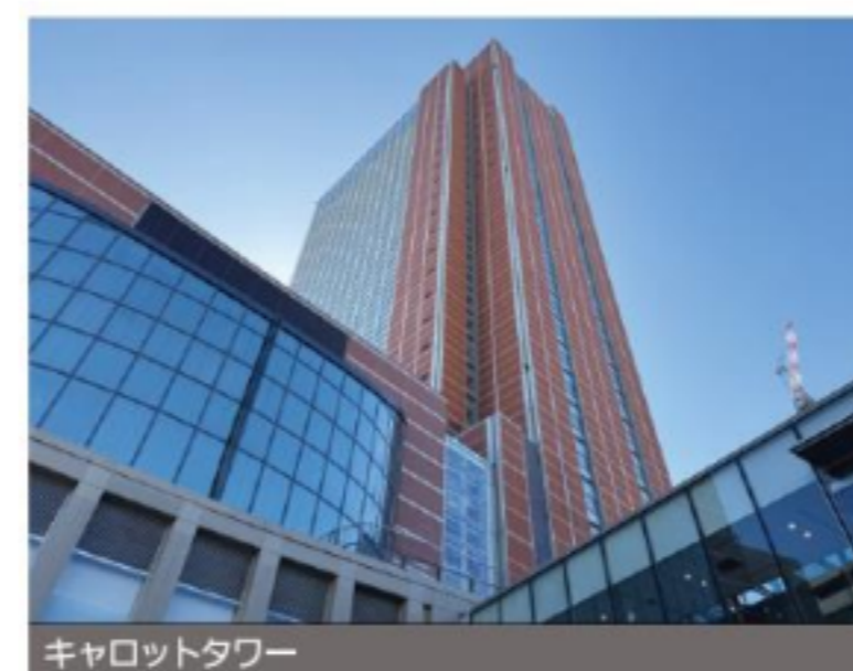
キャロットタワー