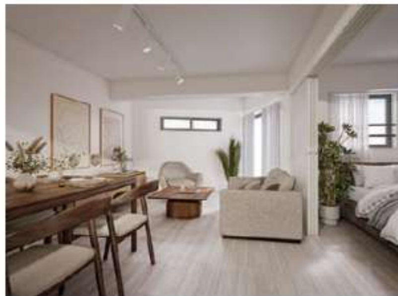
105 / 205