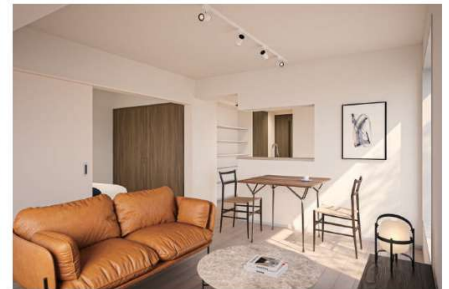
開放感のあるカウンターキッチンを取り入れた1LDK・広々としたルーフバルコニーがある2LDKなど、ゆったりとしたLDKを中心としたプランが揃っています。