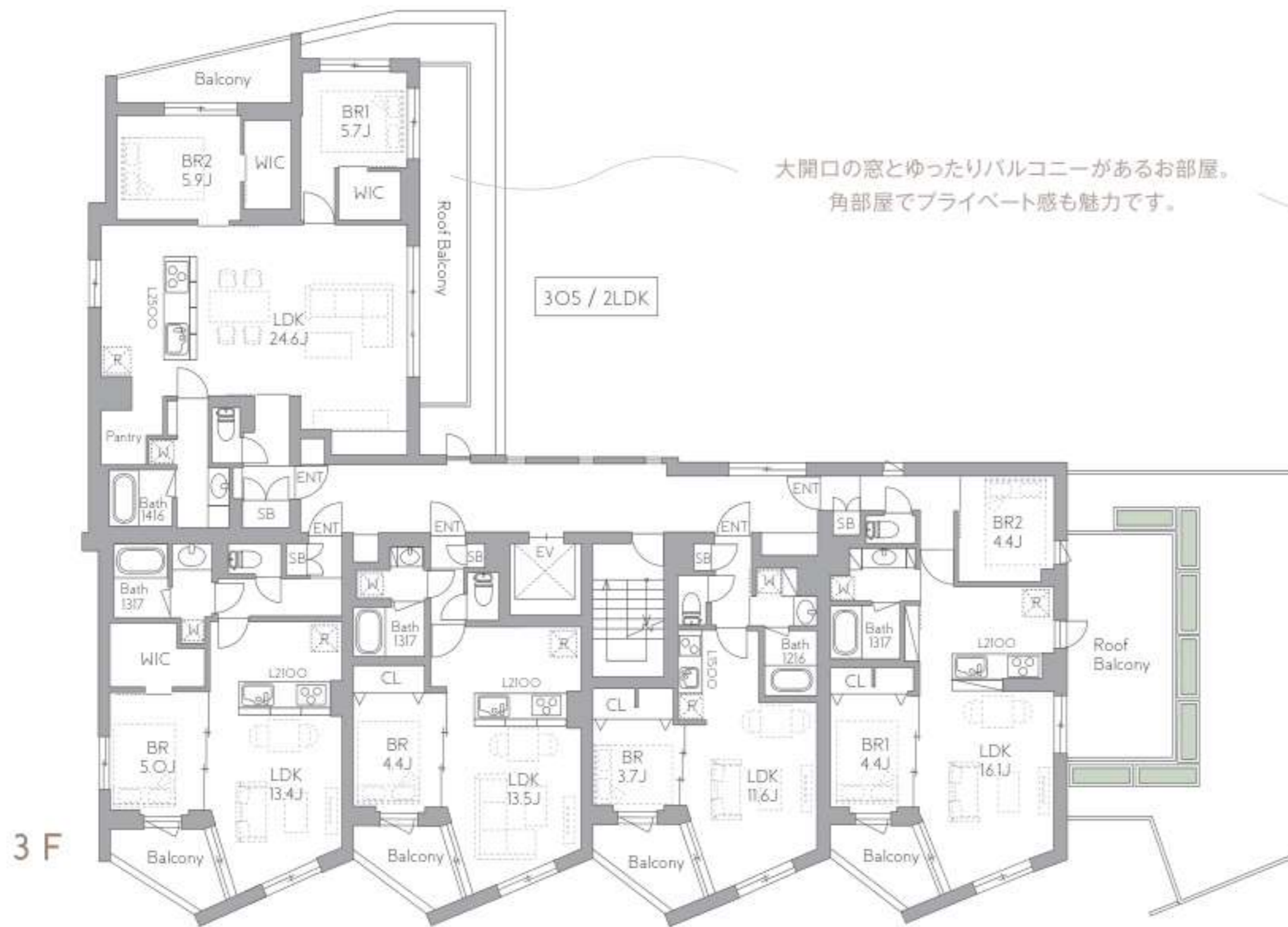
301/ILDK 302/ILDK 303/ILDK 304/2LDK