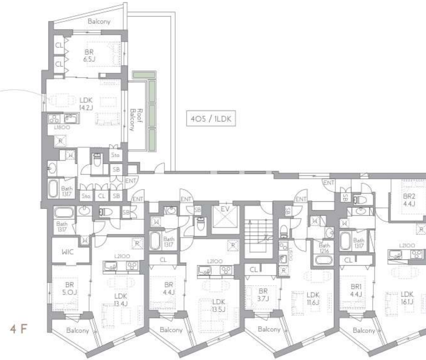
401/ILDK 402/ILDK 403/ILDK 404/2LDK