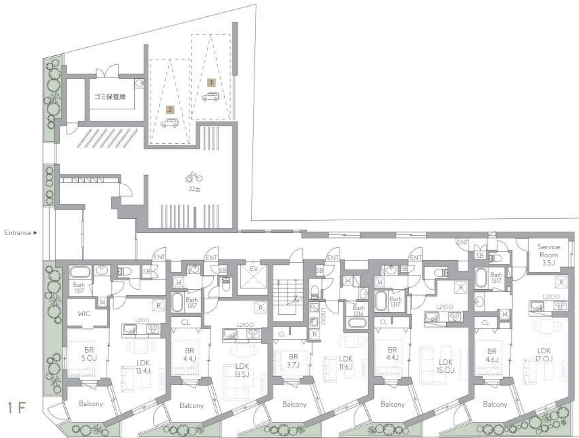
101/ILDK 102/ILDK 103/ILDK 104/ILDK 105/ISLDK