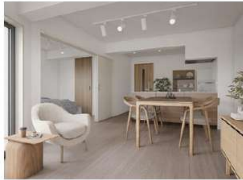
101 / 201 / 301 / 401