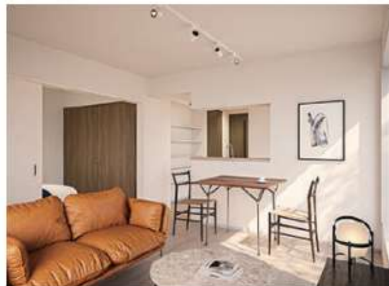
304 / 404