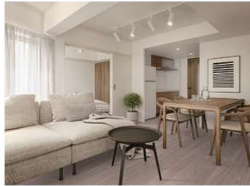
103 / 203 / 303 / 403