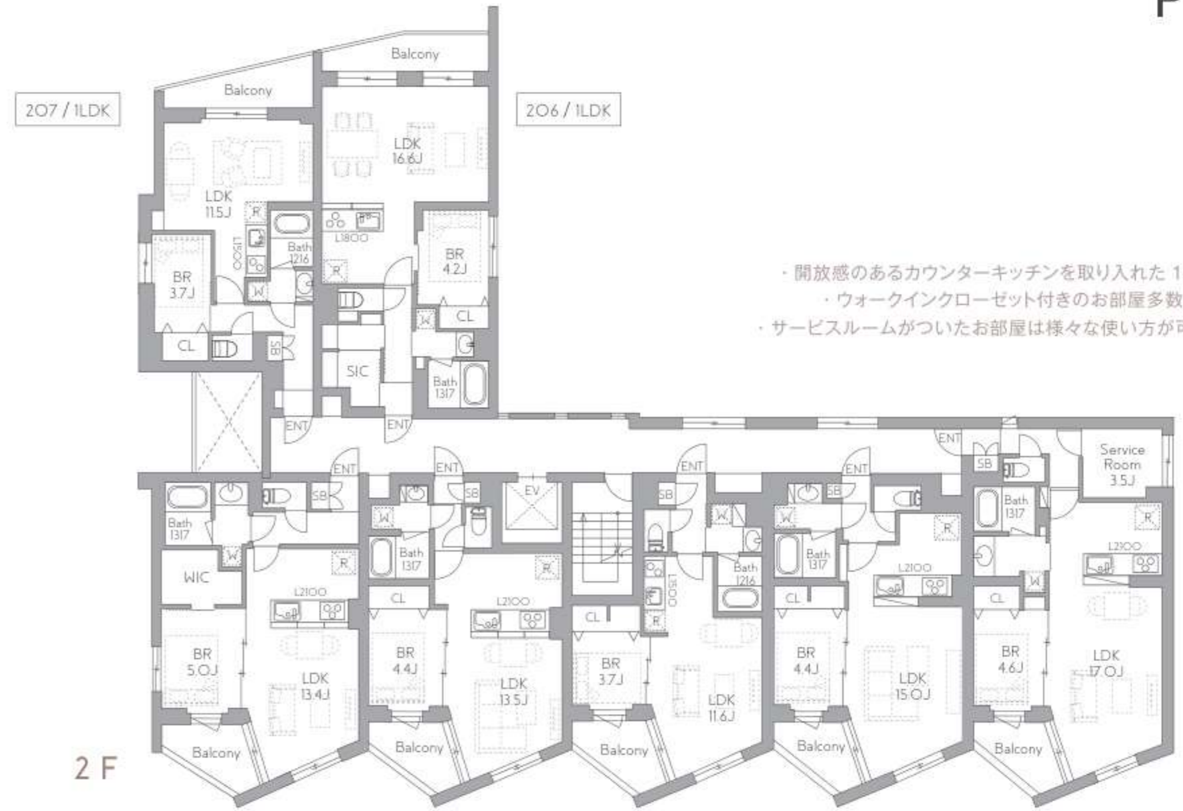
207/ILDK 206/ILDK 201/ILDK 202/ILDK 203/ILDK 204/ILDK 205/ISLDK