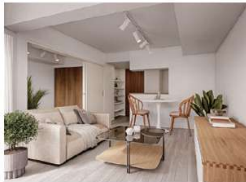
104 / 204