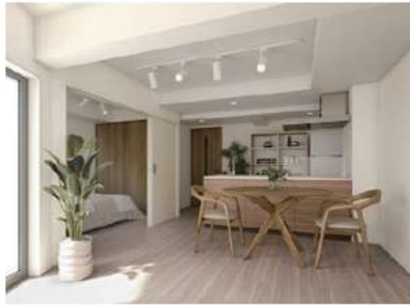
102 / 202 / 302 / 402