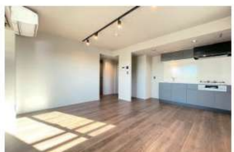
401 / 2LDK