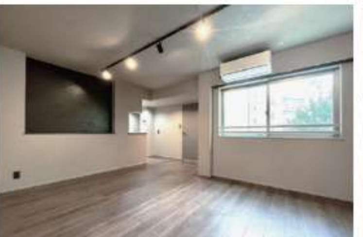
303 / 1LDK