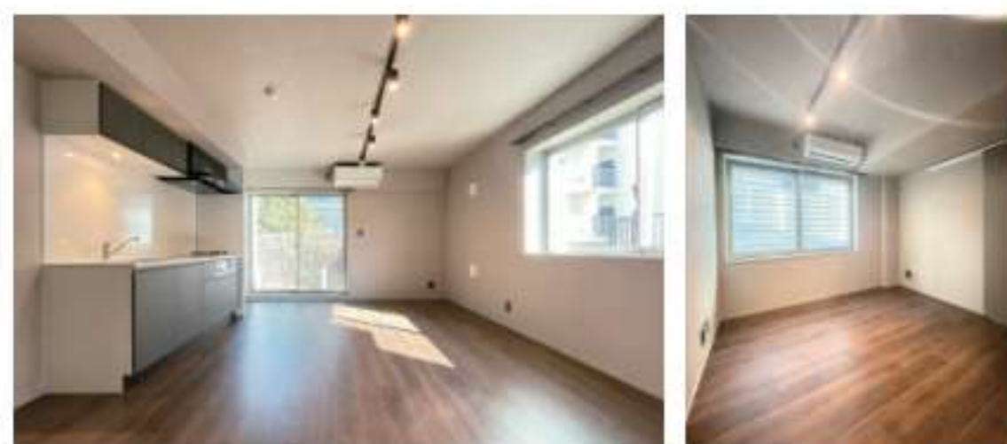
101 / 2LDK