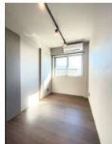
202 / 2LDK (302 同タイプ)