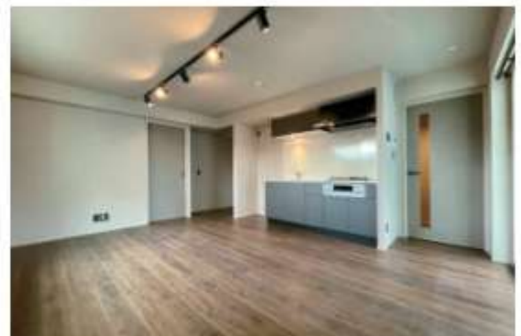
201 / 2LDK