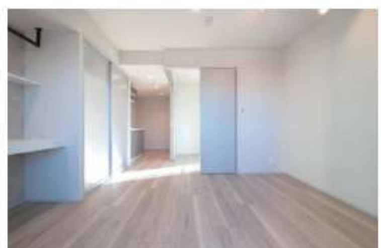
304 / 1LDK