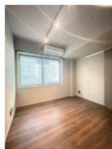
102 / 2LDK