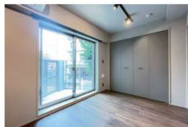
202 / 2LDK