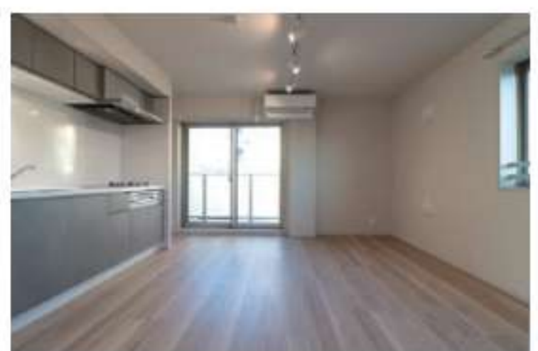
301 / 1LDK