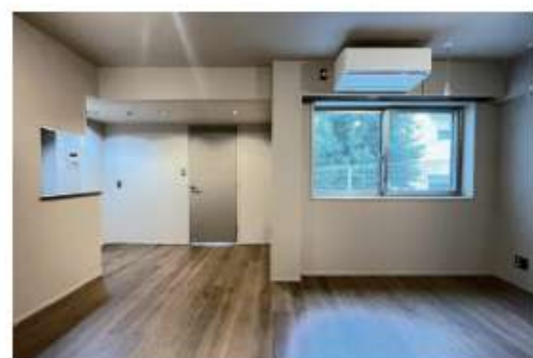
201 / 2LDK