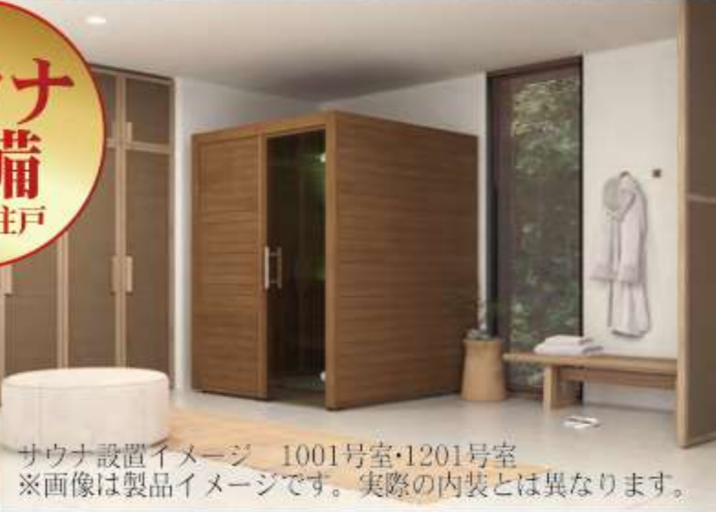
サウナ設置イメージ 1001号室・1201号室 ※画像は製品イメージです。実際の内装とは異なります。