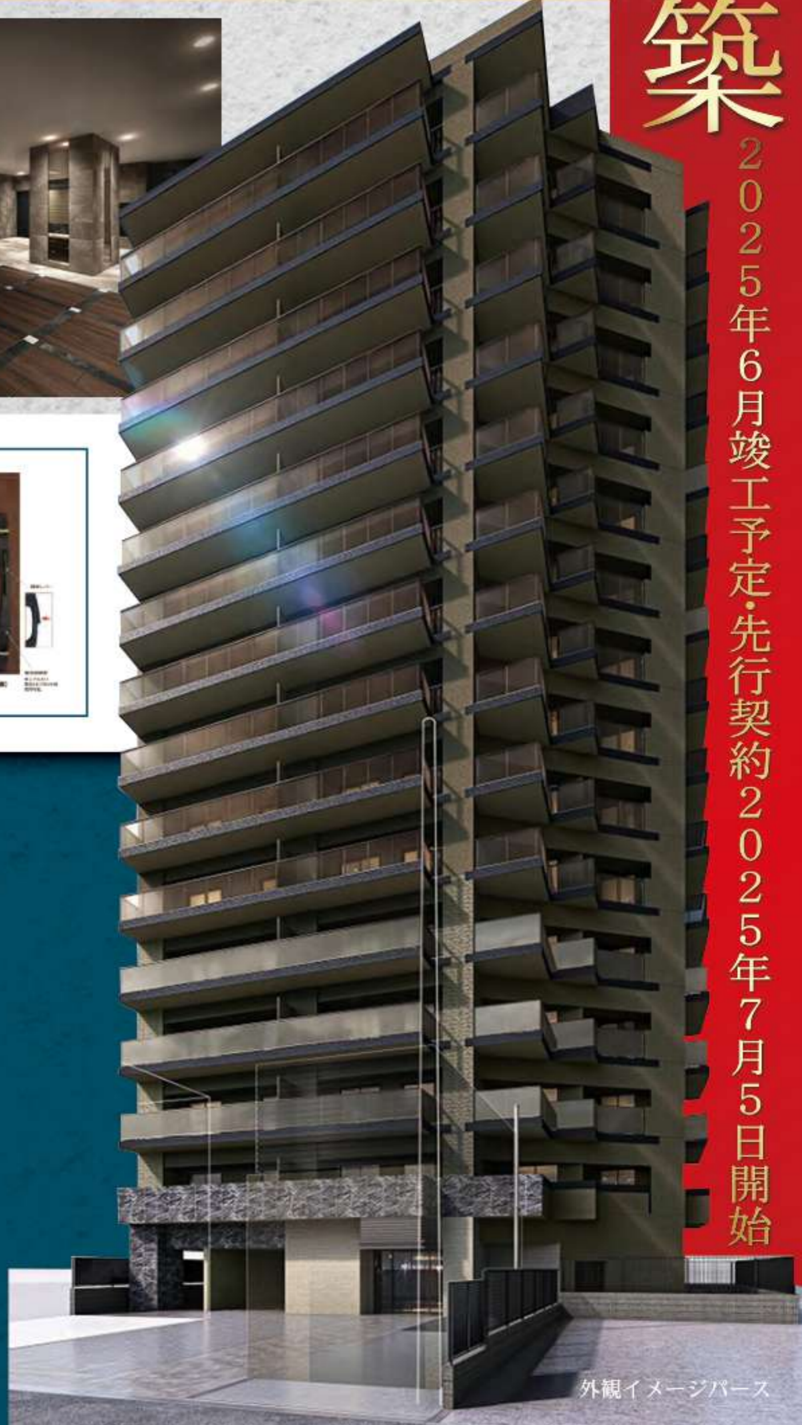
外観イメージパース