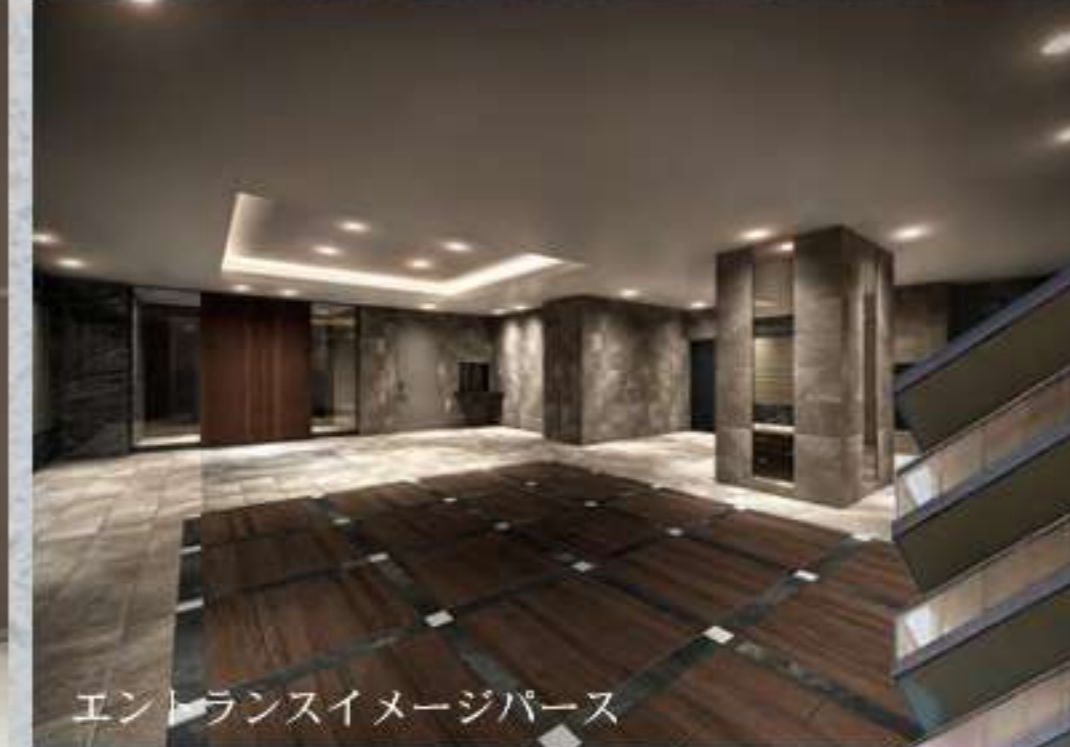
エントランスイメージパース

自分らしいライフスタイルを 描ける洗練された佇まい。 日常のあらゆるシーンに 心地よさと上質さを 提案する設備と仕様。