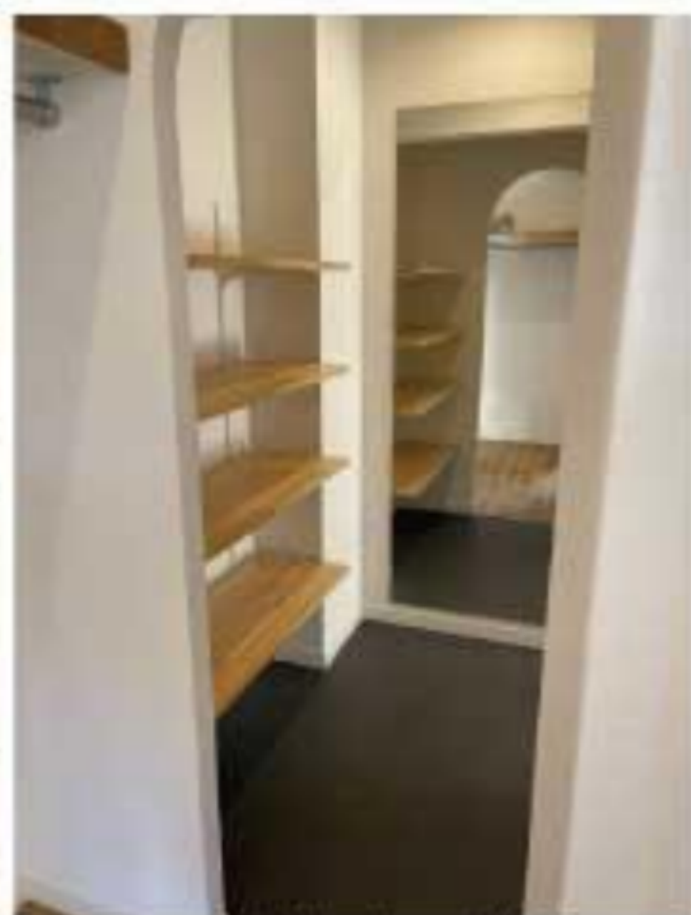
シューズインクローゼット