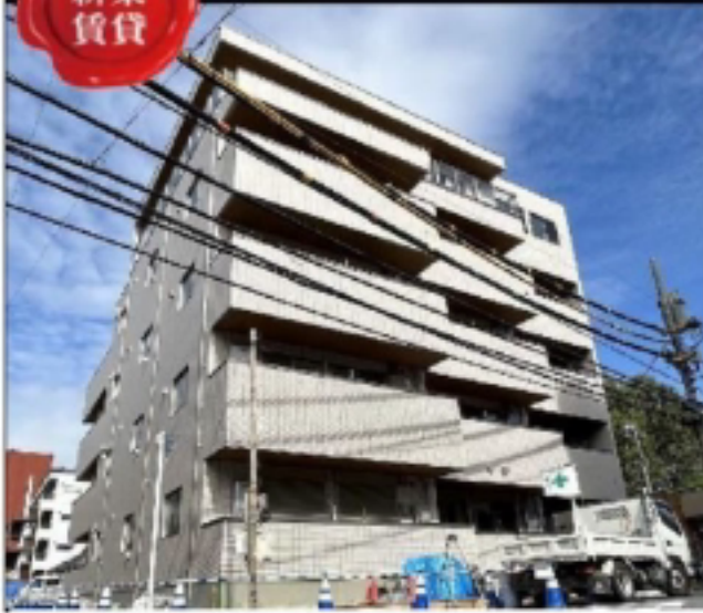
※図面と異なる場合は現況が優先となります。

常磐線・千代田線「綾瀬」駅 徒歩 7分 つくばエクスプレス「青井」駅 徒歩 15分