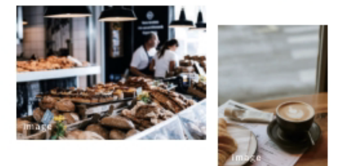
代々木上原周辺は、カフェ・ベーカリー・レストランなど、“気軽だけど高いセンスと緑を身近に感じるエリアです”