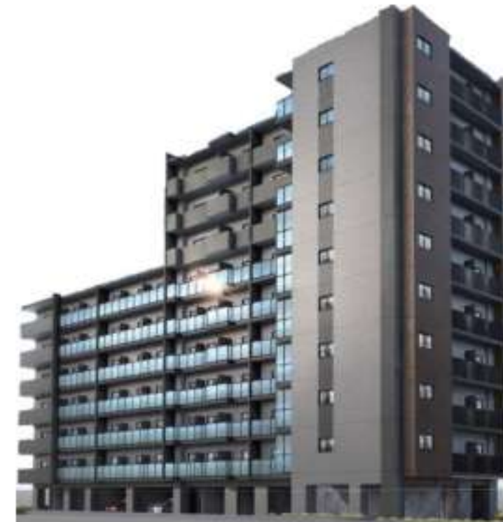
※図面が現状と異なる場合は、現状を優先とします。