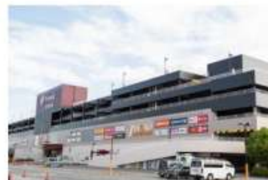
ホームセンター 車8分