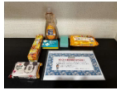
新生活応援グッズ