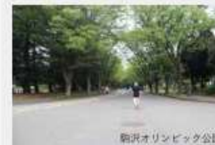
駒沢オリンピック公園