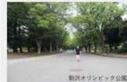
駒沢オリンピック公園

駅前の国道 246 号線沿いには、スーパー、飲食店、銀行など、生活に便利な施設が集結しています。