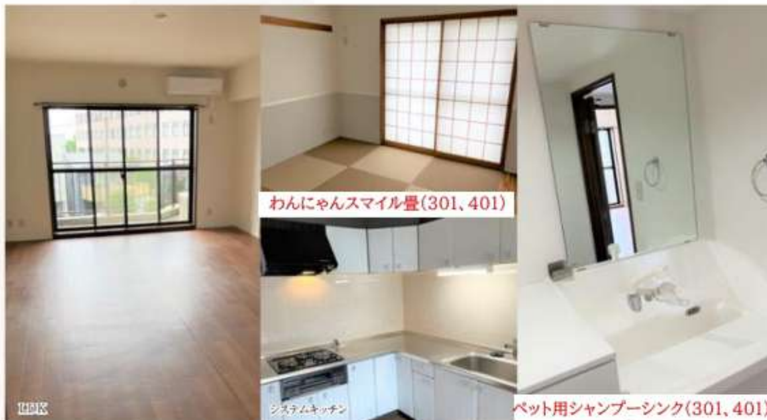
わんにゃんスマイル畳(301, 401)