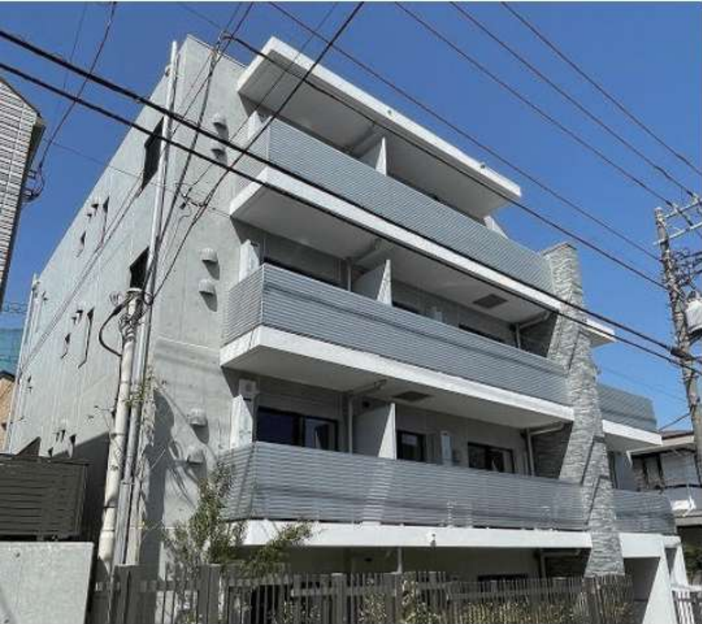
グランデュオ西荻窪 2