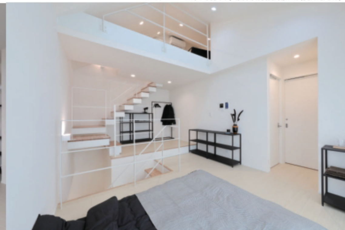
※モデルルーム時の写真です。家具等は賃貸対象には含まれません。