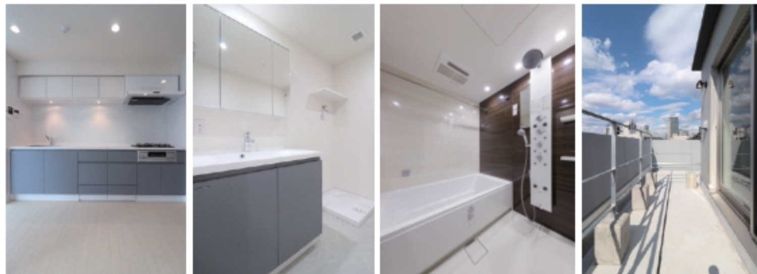
節水&全身が温まるオーバーヘッドシャワー&ボディシャワー付き