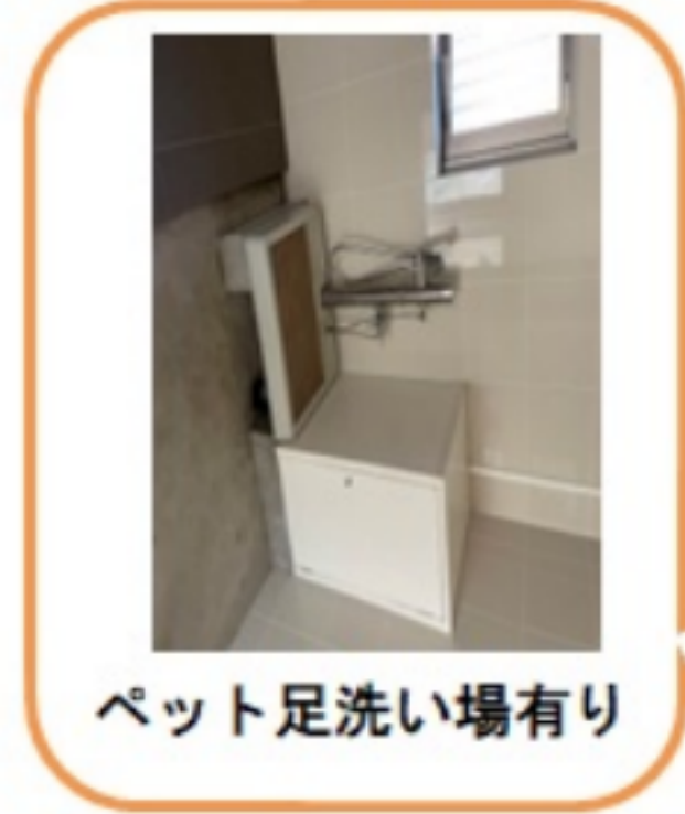
ペット足洗い場有り