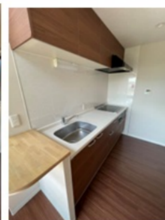
室内写真は間取りが同じ参照画像です