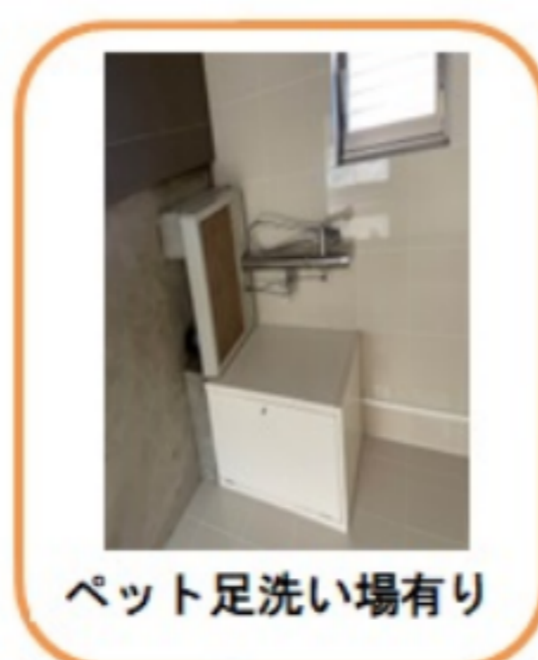
ペット足洗い場有り