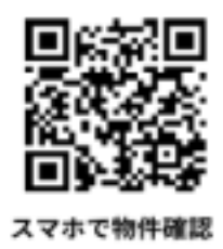
スマホで物件確認