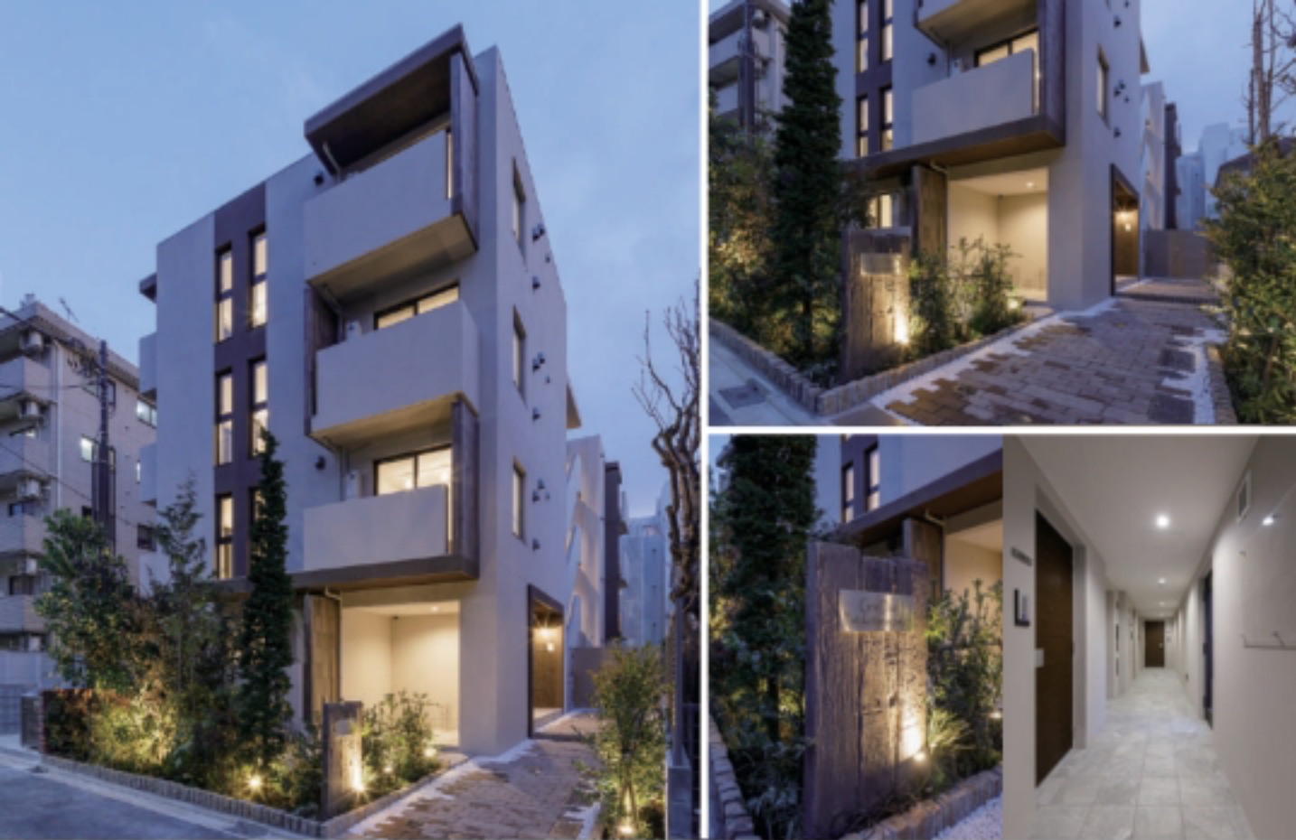
グランデュオ二子玉川5 / 1LDK・103号室