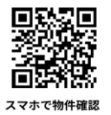
スマホで物件確認