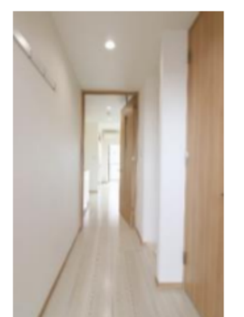
奥行き感じる廊下