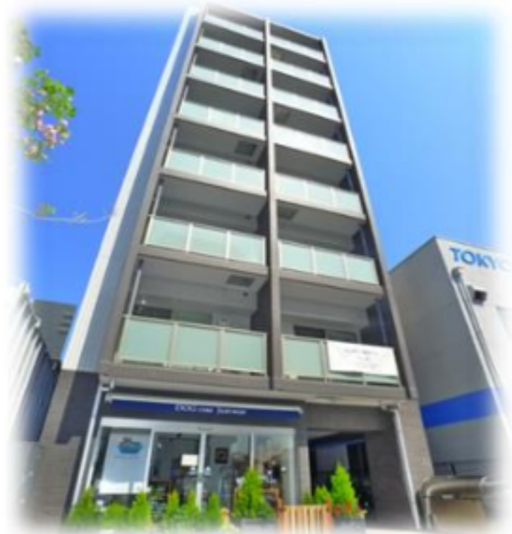
2019年築のハイグレードマンション