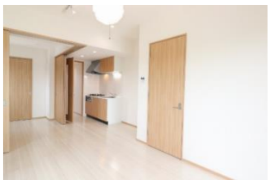
アクセントの効いた 落ち着いた落ち着いた空間