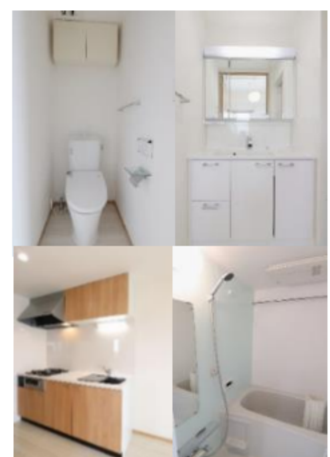
◇清潔感溢れる水回り◇ 水回りの収納スペースも充実！