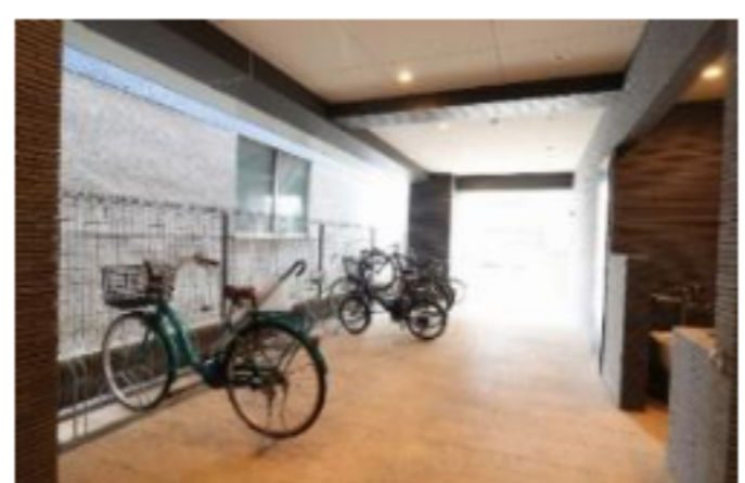
整備されたエントランス、駐輪場