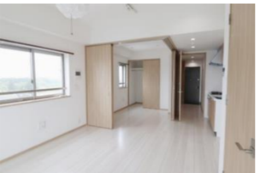
開放感のある室内