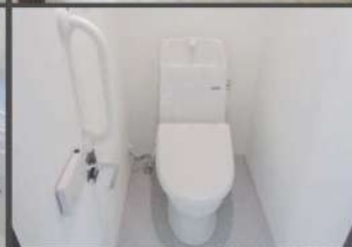
※写真はイメージ写真使用