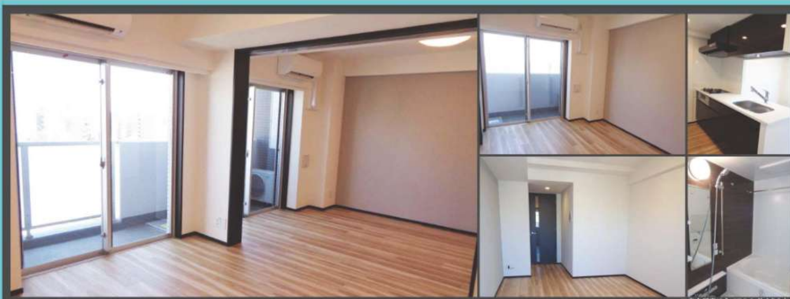
※室内写真は全て且タイプとなります。