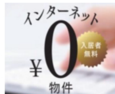
●インターネット入居者無料