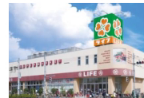
●ライフ六町駅前店

【物件概要】 ●所在地/東京都足立区南花畑3-6-11 ●建物名称/サザンフロント六町 ●交通/つくばエクスプレス線「六町」駅徒歩10分 ●構造/木造3階建 ●完成/2018年7月 ●契約形態/普通借家契約 ●契約期間/2年間 ●中途解約/可(1ヶ月前通知) ●その他/ペット可(猫2匹まで 犬は不可) 【設備概要】 インターネット(1Gbps)無料※有線/オートロック/宅配ボックス/独立洗面台/エアコン/フローリング/照明(居室)/バス・トイレ別/システムキッチン(2口ガスコンロ)/室内洗濯機置場/温水洗浄便座/カラーモニター付きインターホン/浴室乾燥機/シューズボックス/玄関ダブルロック/ディンプルキー/敷地内ゴミ置き場/駐輪スペース/プロパンガス(エネアーク関東※保証金15,000円開栓時) 【初期費用】 ●敷金0ヶ月/礼金0ヶ月 ※ペット(猫2匹まで)飼育の場合は敷金1ヶ月追加 ●保証料(保証会社必須:ROOM ID) 賃料+共益費の50% ※法人契約等の理由により保証会社未加入の場合は敷金1ヶ月になります ●家財保険 加入要:18,000円/2年 ●書類作成費 2,000円(税別) ●鍵交換/25,000円(税別) ●IOサポート倶楽部/10,000円(税別) 初回のみ 【その他費用】 ●月額保証料/賃料+共益費の1% ●更新料/新賃料の1ヶ月分 ●退去時ルームクリーニング費用 1K40,000円(税別) ※支払は解約時 ●短期解約違約金/1年以内の解約・賃料の2ヶ月分/2年以上の解約・賃料の1ヶ月分 【申込方法】『内見予約くん』で申込書式を取得し、①記入済申込書 ②運転免許証またはパスポート ③健康保険証または内定通知書 ④源泉徴収票⑤申込時確認事項の5点を下記宛にメール ※内見前のお申込みは先行契約になります ※掲載写真は2018年8月撮影