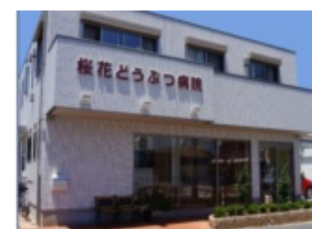
●桜花動物病院180m(徒歩2分)