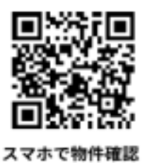
スマホで物件確認