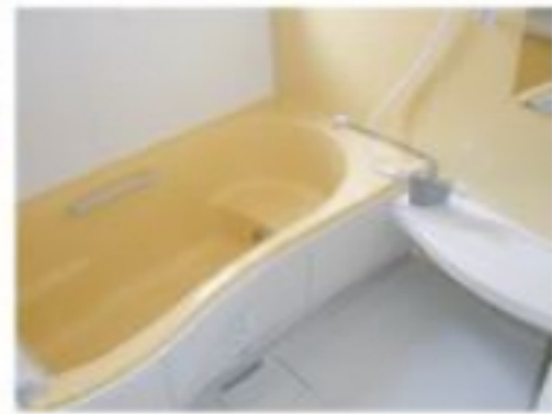
※写真は別のお部屋です。