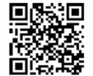
スマホで物件確認