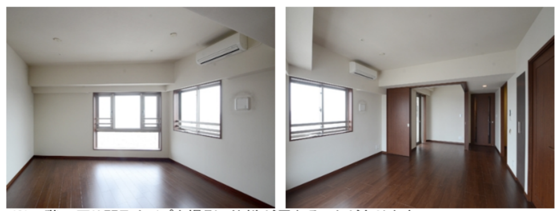
※28階の同じ間取タイプを撮影。仕様が異なることがあります。