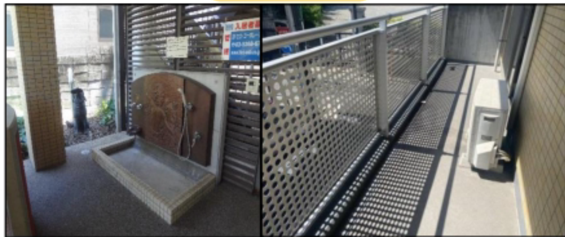
ペット専用温水足洗い場