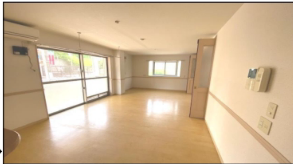
日当たり良好でペットちゃんとお部屋で日光浴♪