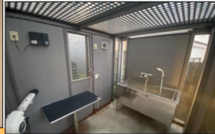
温水グルーミングスペース