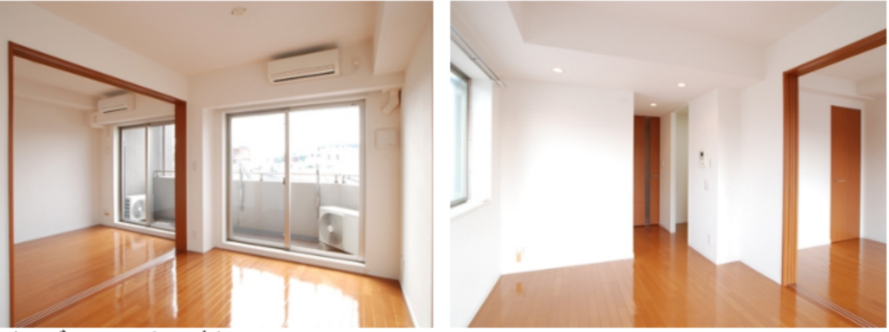
(モデルルームです)