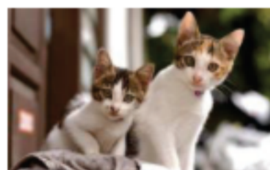
多頭飼いき 飼育細則、頭数制限あり