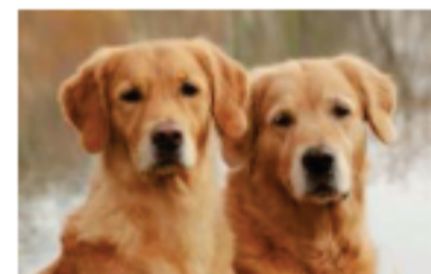
大型犬相談 飼育細則、頭数制限あり