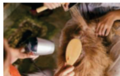
箱型の乾燥機 トリミングルームに設置