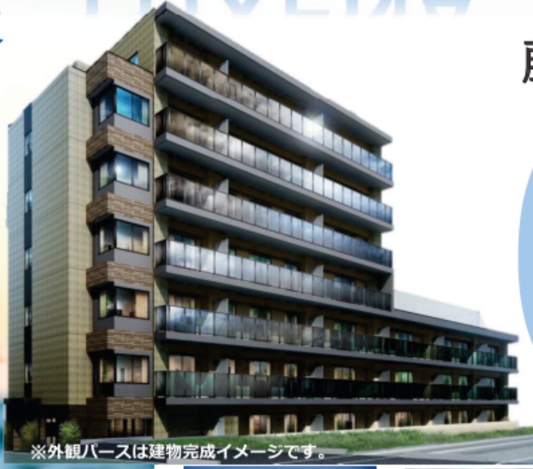
※外観パースは建物完成イメージです。