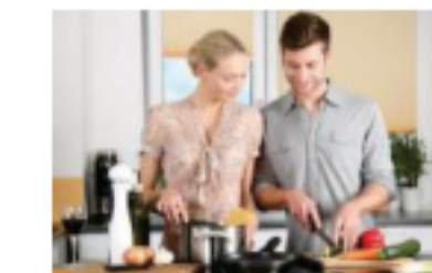
タッチレス水栓 2LDK以上の住戸