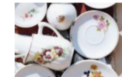
食洗器 2LDK以上の住戸

■所在地/神奈川県藤沢市弥勒寺1丁目6番1号 ■竣工2026年1月27日 ■入居可能日:2026年2月21日 ■交通/JR東海道線「藤沢」駅南口徒歩12分、江ノ島電鉄「藤沢」駅徒歩18分 ■構造・規模/鉄筋コンクリート造地上7階建 ■総戸数/41戸 ■間取り/1LDK・2LDK・2SLDK・3LDK ■専有面積/35.18㎡~66.04㎡ ■敷金/0ヶ月(ペット飼育時/小型犬・猫合わせて2匹の場合敷金+1ヶ月/その他の場合敷金+2ヶ月) ■償却なし ■礼金/0ヶ月 ■共益費/10,000円(G・H・I type) 20,000円(A・B・C・D・E・F type) ■契約期間/2年間 ■更新料/新賃料の1ヶ月分 ■火災保険/21,500円/2年間 ■保証会社/必須(エポスカード保証のみ) 初回保証料50%、月額保証料 月額支払総賃料の1% ※賃主の認める法人契約の場合、加入不要。但し、敷金1ヶ月に変更。 ■ペット登録/ペット登録費用5,500円(10%税込) ペット追加時登録費用3,300円(10%税込) ※申込時に必要書類提出・ペット審査有 ■鍵設定費/11,000円(税込) ■ルームクリーニング代/Atype:102,300円(税込) B・E・F type:101,200円(税込) C type:97,900円(税込) D type:94,600円(税込) G・H type:55,000円(税込) I type:64,900円(税込) ■エアコンクリーニング費用/1台につき19,800円(税込) ■駐車場(25台)/機械式21台:11,000円~16,500円(税込/台)、平置き3台:22,000円(税込/台) ※サイズ奥行4,900×幅2,200・敷金1ヶ月、契約事務手数料1.1ヶ月、敷地外1台:16,500円(税込/台)敷金1ヶ月、契約事務手数料1.1ヶ月 ■バイク置場(3台)/月額5,500円(税込/台)敷金1ヶ月、契約事務手数料1.1ヶ月 ■駐輪場(56台)/月額220円(税込/台) ※入居期間中に駐輪場を新規で使用する場合、ステッカー発行手数料1,100円(税込)/1台が発生します。 ■引越し業者:当社指定がございます(引越し日時は先着順です) ■ペット飼育細則あり ■解約予告:1ヶ月前 ※留学生がお申込みの場合、代理契約をお願いします