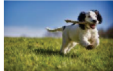
芝生ドッグラン 屋上に天然芝生のドッグラン