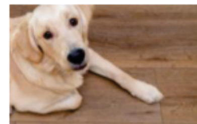
ペット対応の床 ペットが滑りにくいフローリング